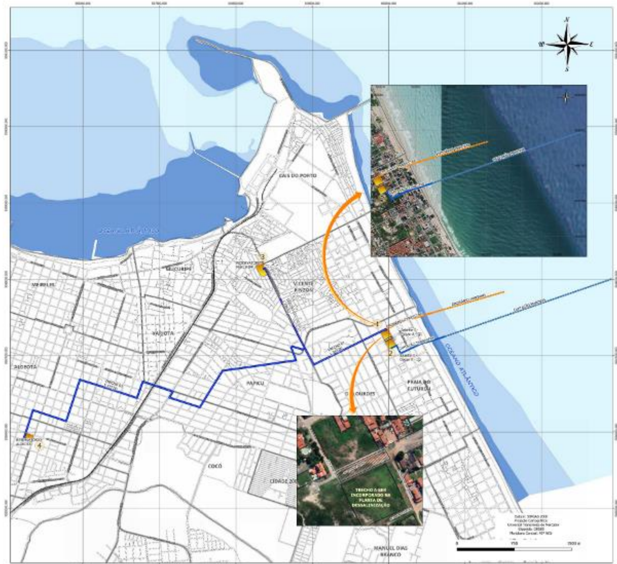
Figura 1. Localização da área da planta de dessalinização e das linhas de captação, emissário e de água tratada.